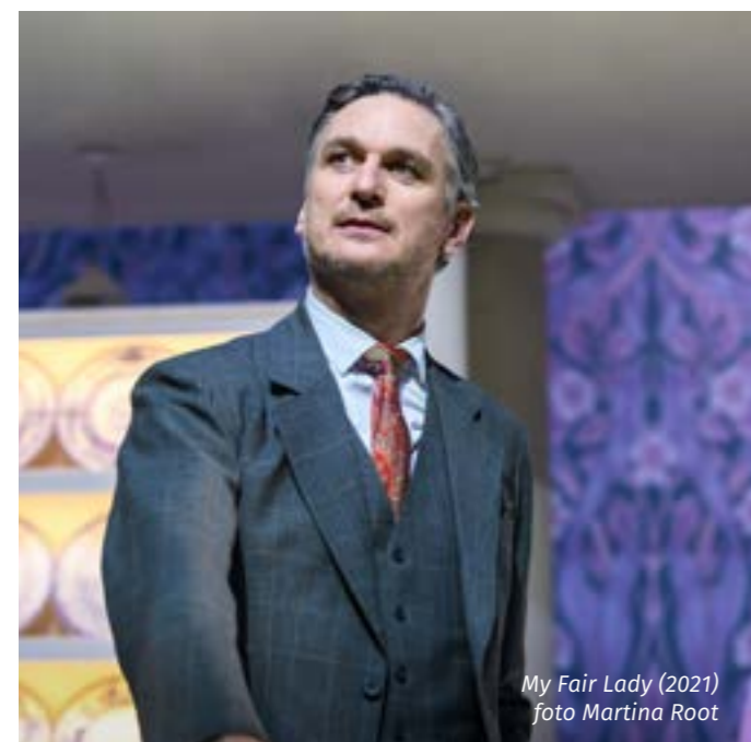
My Fair Lady (2021)

Když jsem řekl mamince, že jsem byl nominován na cenu, řekla: „Jen aby ti ji ale dali!“ Tím mi potvrdila, že se nám Čechům zdá neproměnná nominace jako totální neúspěch. Prohra. Ale tak to přece není. V životopisech mých herců se budou hrdě zmiňovat všechny nominace. Jen ať se ví, že jejich výkony jsou často mimořádné!