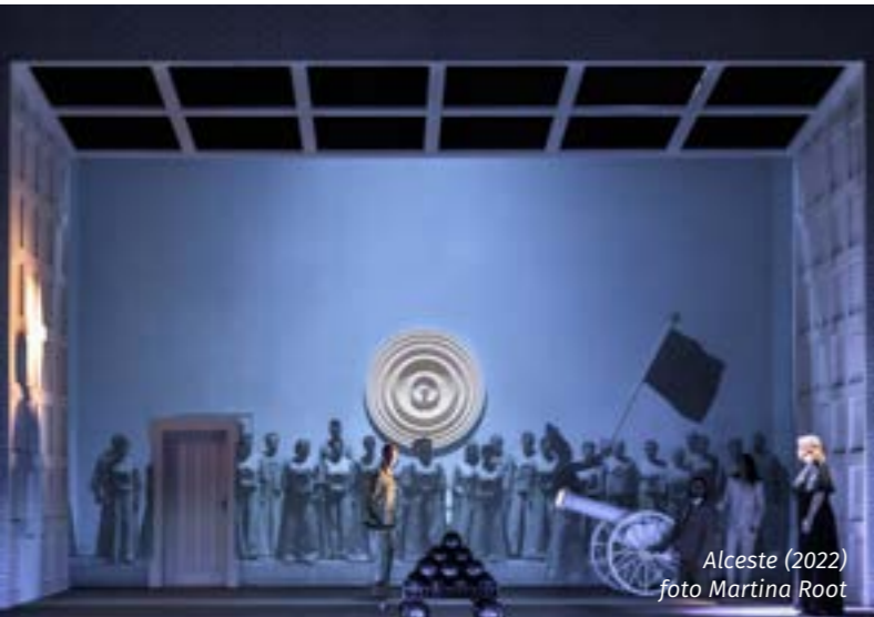
Alceste (2022)