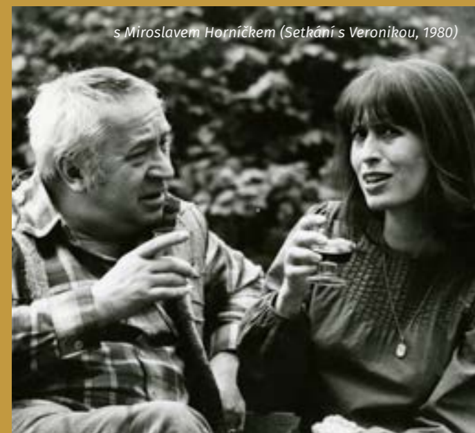
s Miroslavem Horníčkem (Setkání s Veronikou, 1980)