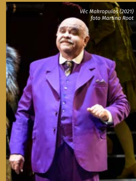
Věc Makropulos (2021)