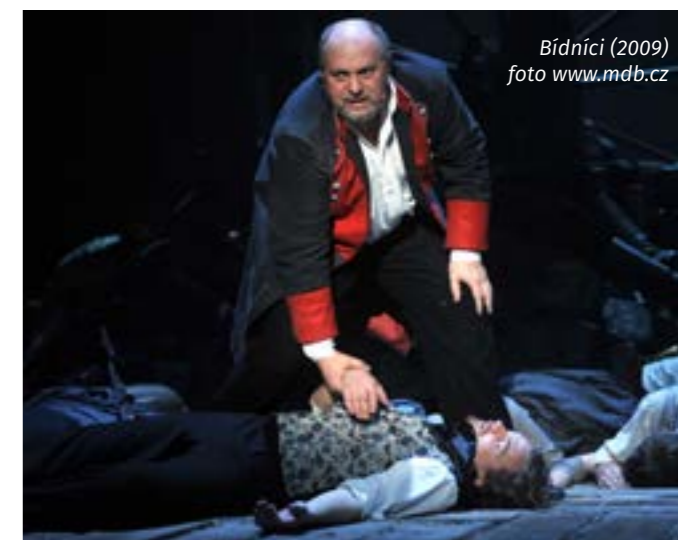
Bídnicí (2009)

Naše oddělení je mladé, a tak má ve všech ročnících cca tři desítky studentů. Někteří mají mimořádný talent a věřím, že brzy o sobě dají vědět.